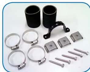
KIT DE CONEXIONES POR PANEL