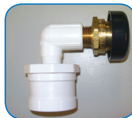
VÁLVULA DE ALIVIO