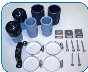
KIT DE CONEXIONES POR SISTEMA